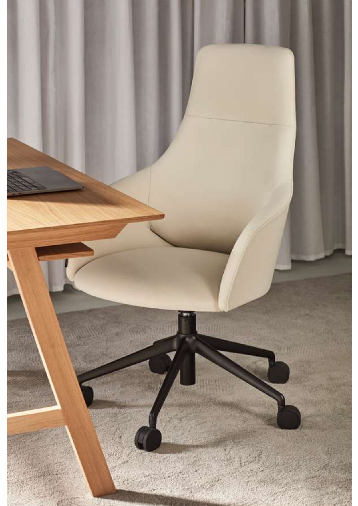
Designed by David Redondo /Diseñado por David Redondo