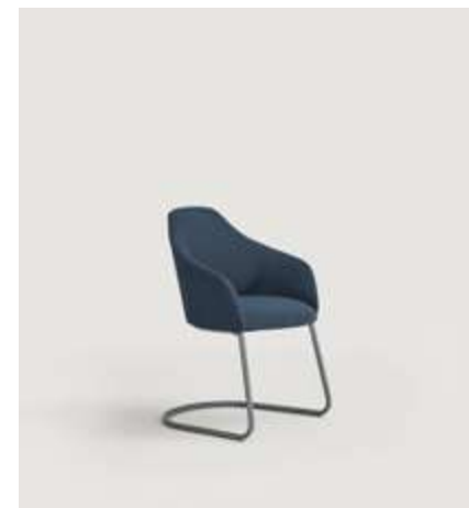
Helium chair upholstered with Moss 45 and cantilever legs painted in R7031 / Silla Helium tapizada con Moss 45 y base cantilével pintada en R7031