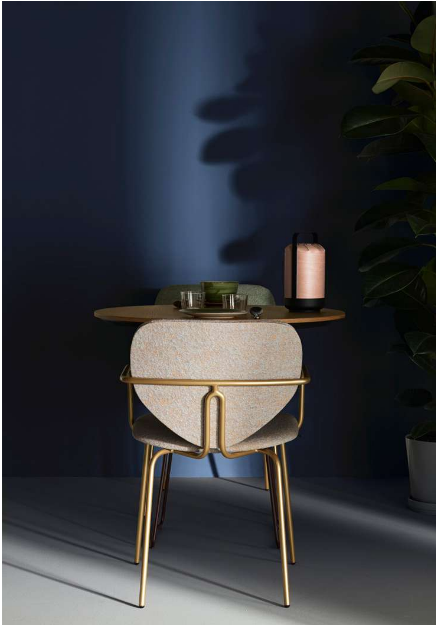
Design by Yonoh / Diseñado por Yonoh