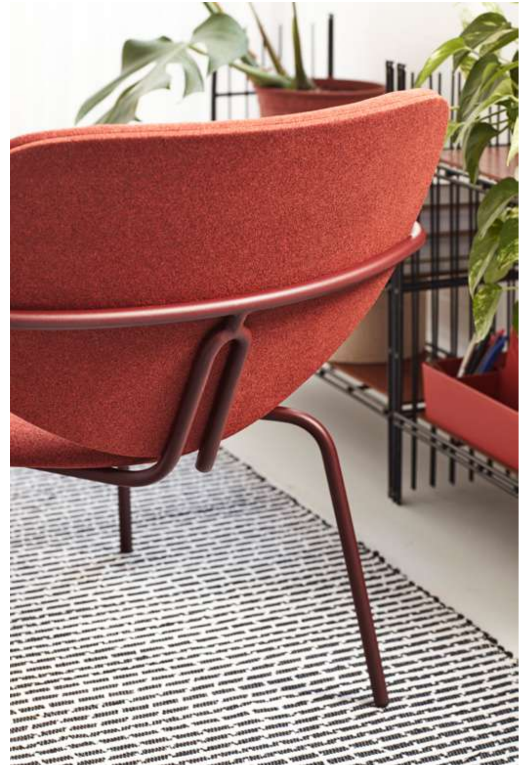
Lounge chair Marietta upholstered with Moss 65 and metal painted in R3004 /Butaca Marietta tapizado en Moss 65 y metal pintado en R3004