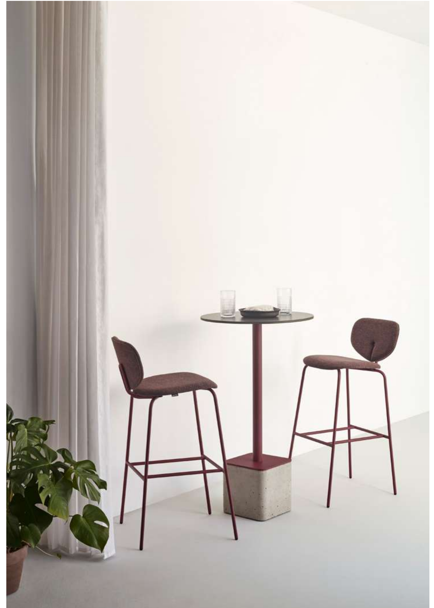
Design by Yonoh / Diseñado por Yonoh