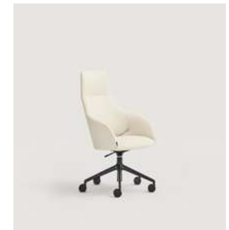
Helium high shell chair upholstered with Desert DE04 leather and five way swivel aluminium base, fitted with castor wheels / Silla Helium carcasa alta tapizada con Desert DE04 y base de aluminio giratoria con 5 radios, equipada con ruedas.