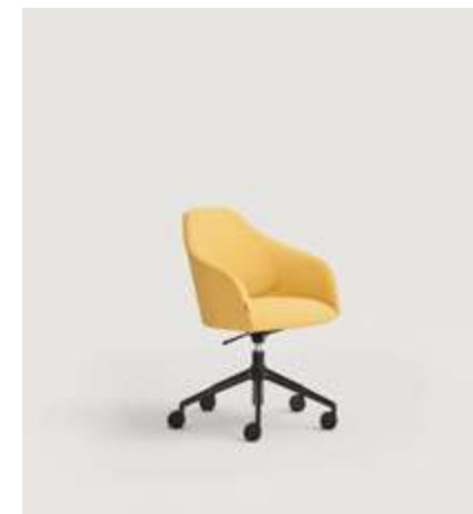
Helium chair upholstered with Moss 16 and five way swivel aluminium base, fitted with castor wheels / Silla Helium tapizada con Moss 16 y base de aluminio giratoria con 5 radios, equipada con ruedas.