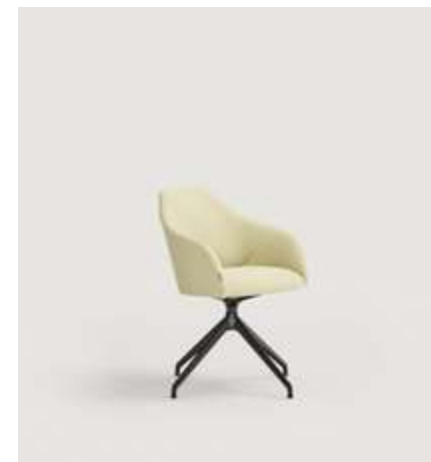
Helium chair upholstered with Moss 30 and four way swivel aluminium base. / Silla Helium tapizada con Moss 30 y base de aluminio giratoria con 4 radios