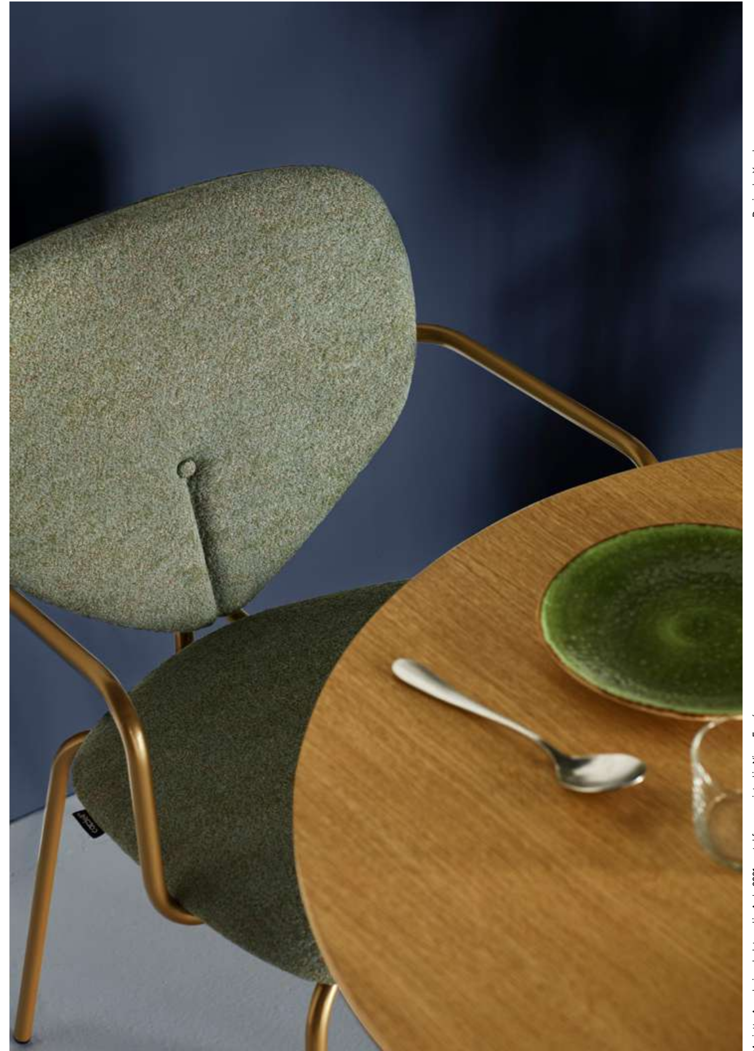
Design by Yonoh / Diseñado por Yonoh