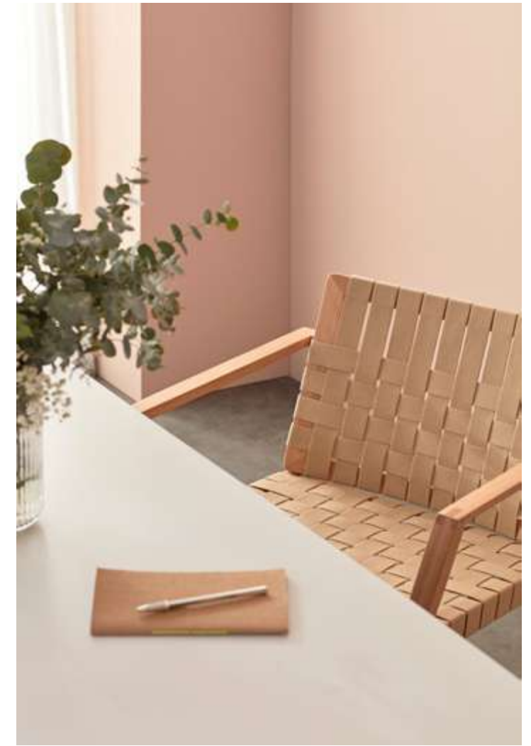
Mesana Table with white HPL top and solid beech wood legs stained in S80 /Mesa Mesana con tapa de HPL blanco y patas de haya maciza tintadas en S80