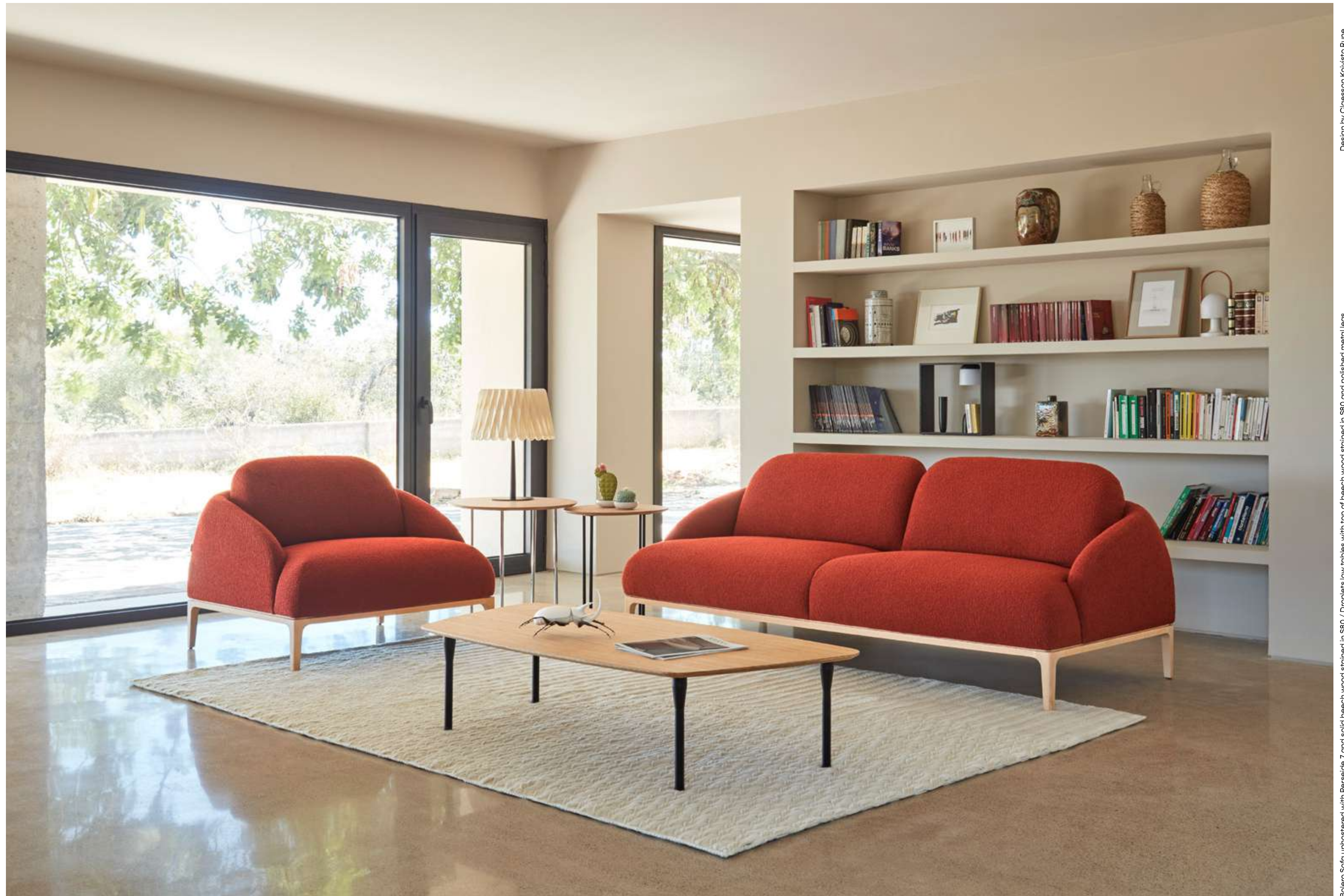
Bolero Sofa upholstered with Perselid 7 and solid beech wood stained in S80 / Droplets low tables with top of beech wood stained in S80 and polished metal legs Sofés Bolero tapizado en Perselid 7 y base de madera de haya maciza tintada en S80 / Mesas bajas droplets de madera de haya tintada en S80 y patas de metal cromado