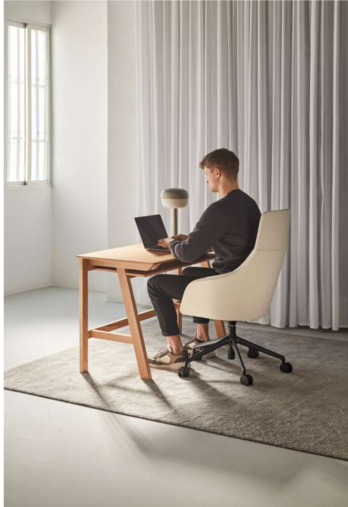
Mesana Desk of oak wood stained in S80 /Mesana Desk de roble tintado en S80