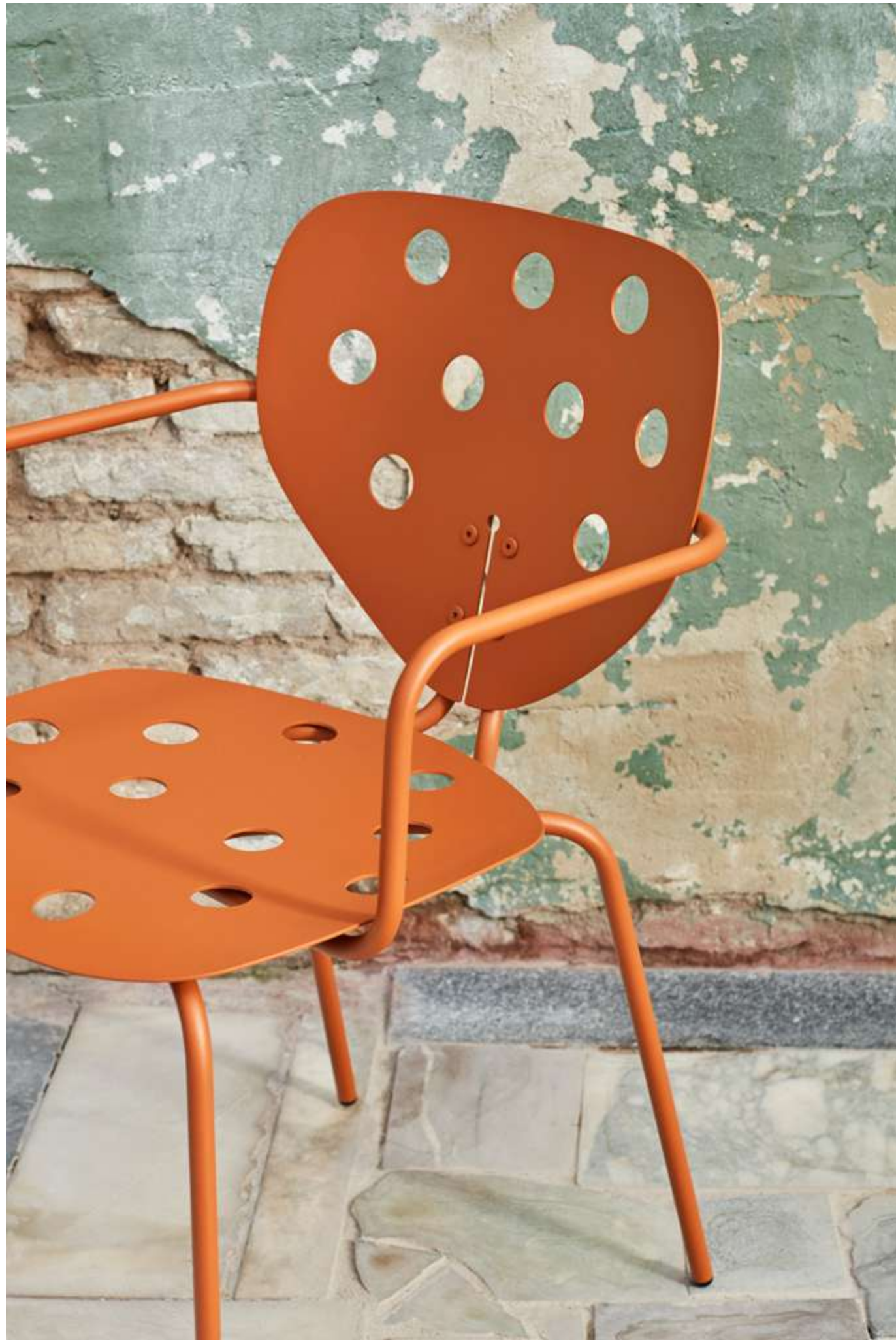
Design by Yonoh / Diseñado por Yonoh