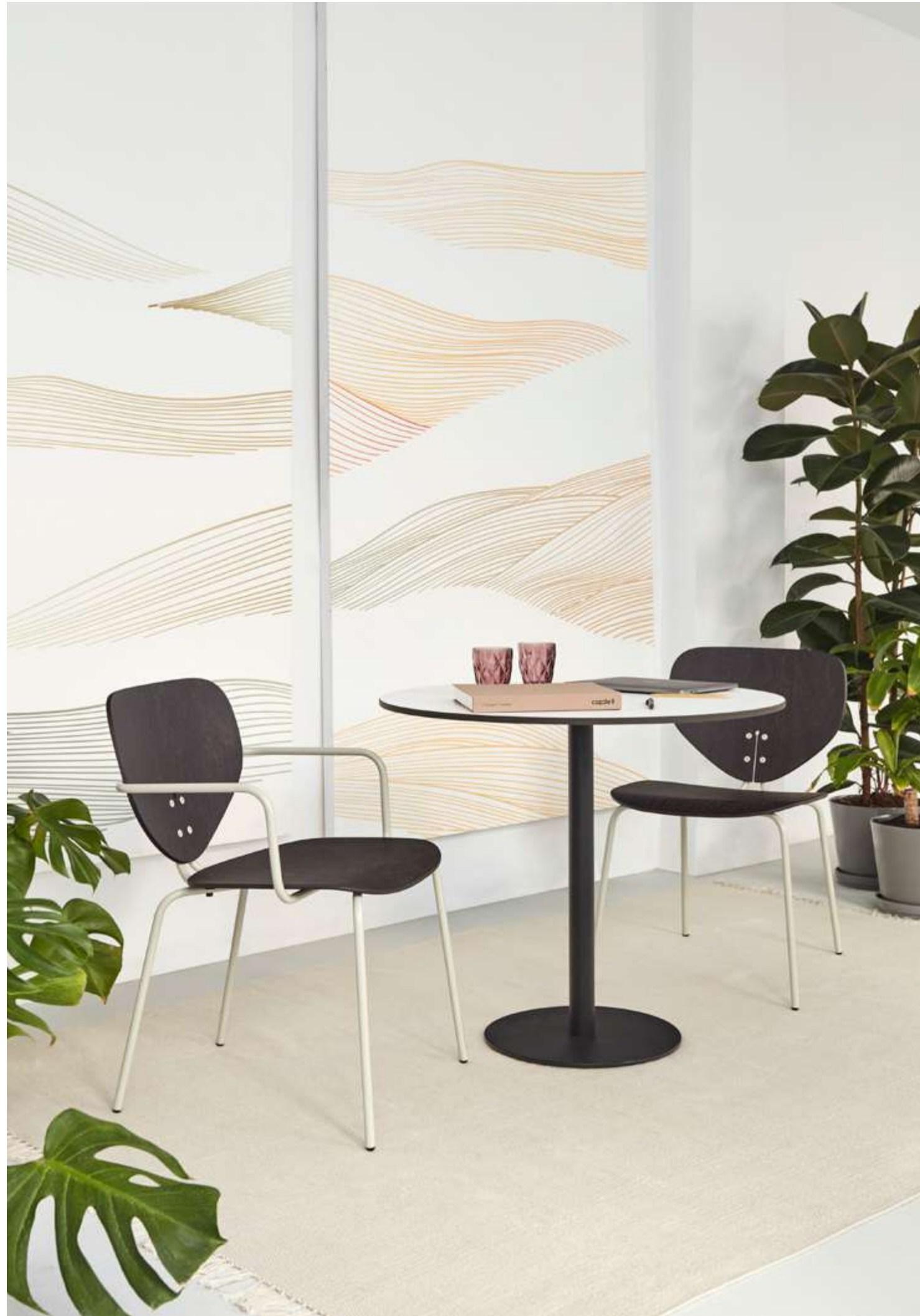
Design by Yonoh / Diseñado por Yonoh