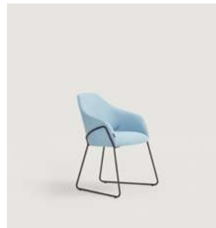
Helium chair upholstered with Moss 40 and metal legs painted in R3007 / Silla Helium tapizada con Moss 40 y patas de patín pintadas en R3007