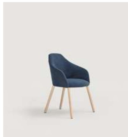
Helium chair upholstered with Oreo 3 and ash wood legs stained in S80 / Silla Helium tapizada con Oreo 3 y patas de madera de fresno tintadas en S80